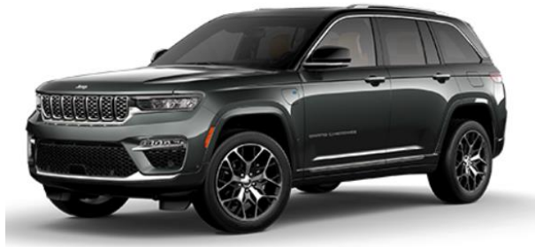
PAS BALTIC GREY МЕТАЛИК 602 BALTIC GREY / BLACK ROOF