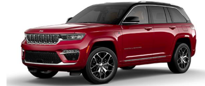
124 VELVET RED / BLACK ROOF