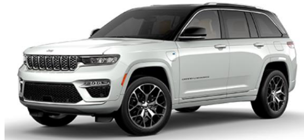
207 BRIGHT WHITE / BLACK ROOF