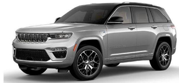
605 SILVER ZYNITH / BLACK ROOF