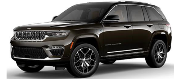
PFJ ROCKY MOUNTAIN 707 ROCKY MOUNTAIN / BLACK ROOF