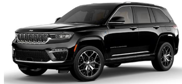
PXJ DIAMOND BLACK