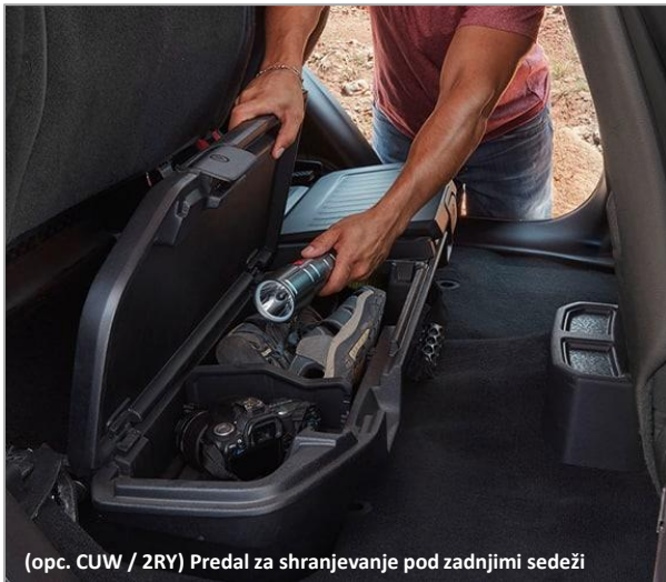
(opc. CUW / 2RY) Predal za shranjevanje pod zadnjimi sedeži