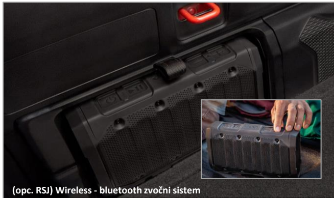
(opc. RSJ) Wireless - bluetooth zvočni sistem