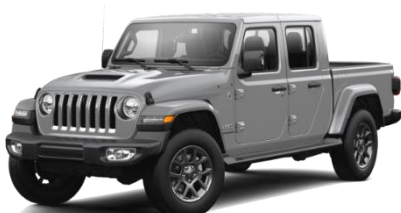
PDN (opc. OSB) Siva Sting-Gray (pastelna barva)